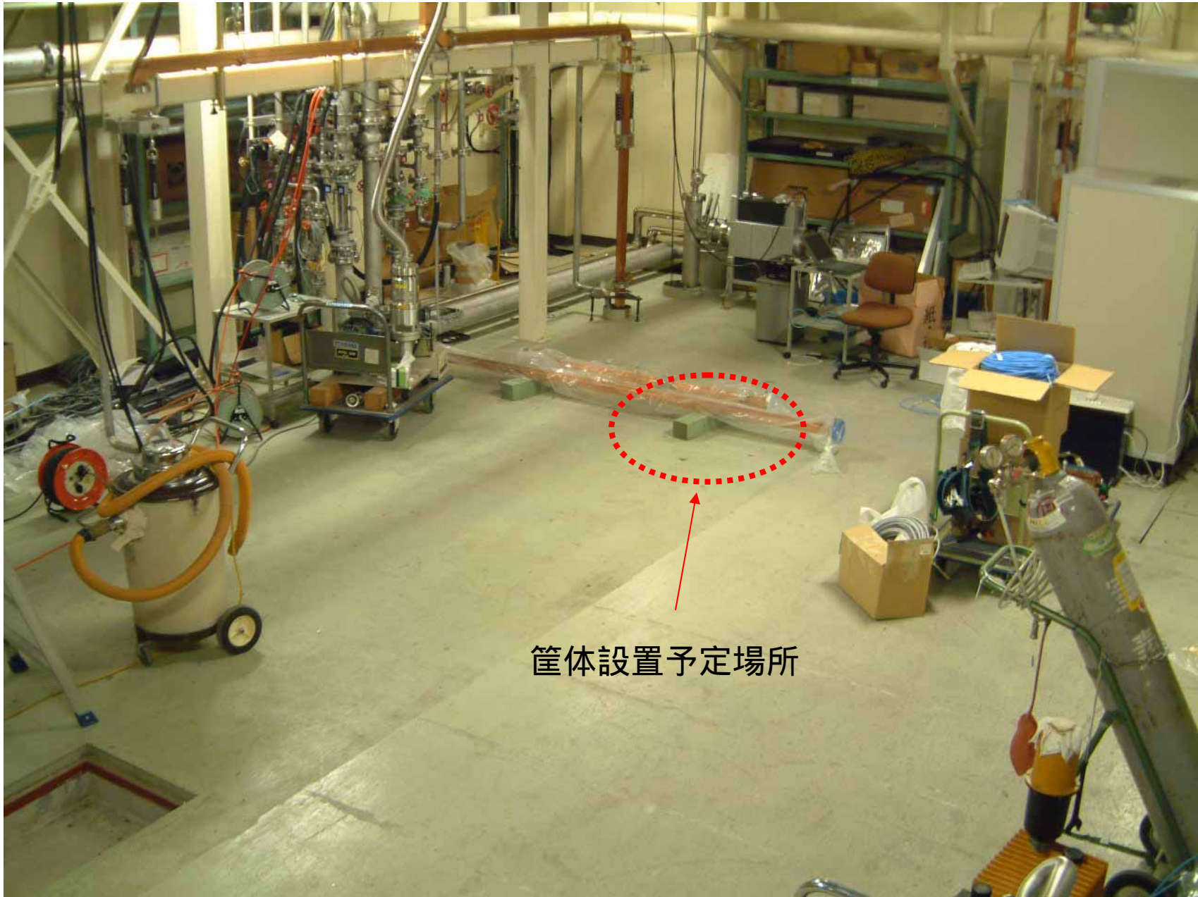
筐体設置予定場所