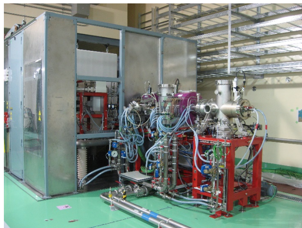
Figure 3: Injector installed at IFMIF/EVEDA accelerator building in Rokkasho.

2013 年 11 月より入射器及び電気設備、熱交換器などの六ヶ所サイト内の IFMIF/EVEDA 開発試験棟への据付が開始された。入射器については、これまでに CEA/Saclay より 6 名の研究者、技術者が六ヶ所サイトに来て、JAEA の研究者、技術者らと一緒に据付作業を行ってきた。Figure 3 に六ヶ所サイトでの入射器の据付作業の状況を示す。