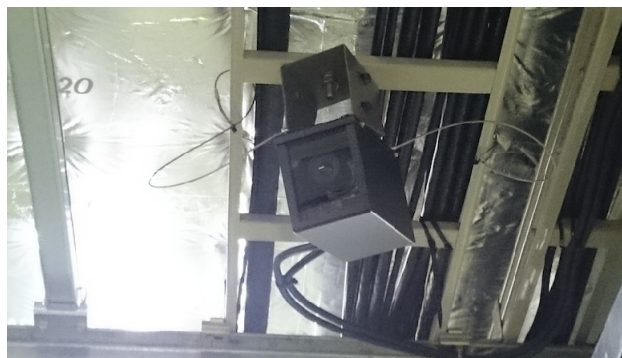
Figure 2: Lead shield of CCD camera.

射直線部に設置された 3 台のカメラを 2014 年から CID (Charge Injection Device)タイプに変えて試験を始めた。本論文では CCD カメラの運用状況と 2017 年夏までのビーム運転により最大約 1000 Gy が CID カメラに照射されたのでその結果やその他問題点について報告し、今後の検討課題等についても述べる。