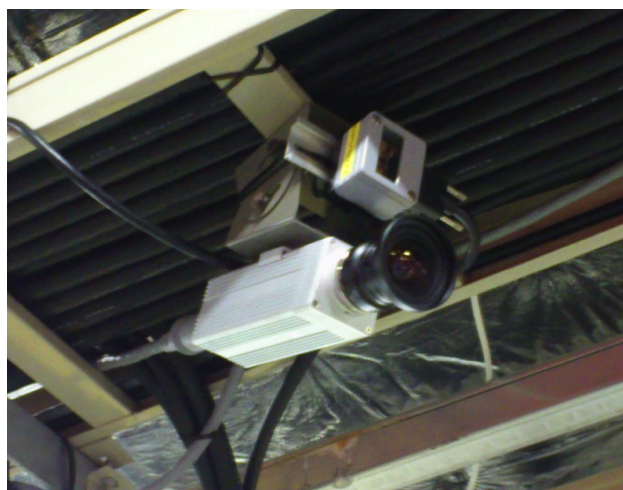
Figure 3: CID camera and RadMon.

ビームロスが特に大きい入射直線部の 3 台の監視カメラ (Figure 1 の 3 個の赤丸) を 2014 年 2 月から CID (Charge Injection Device) タイプに変えて試験を始めた。この CID カメラは Thermo Scientific 社の CID8725D で、ガンマドーズで 30 kGy という仕様のものである。Figure 3 は EMG-8 の監視カメラの場所に設置した CID カメラである。EMG-8 カメラは NU 運転時の MR トンネル監視カ