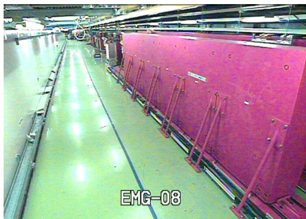
Figure 5: Video image of CCD Camera.